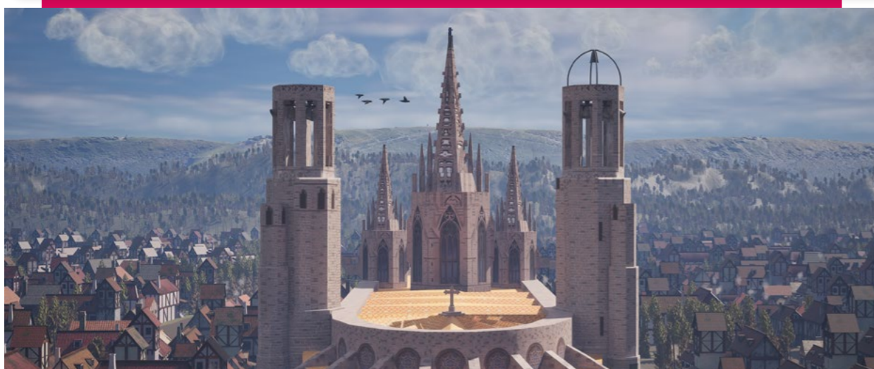
Recreación de Barcelona en la Edad Media. Fotogramas de la experiencia.