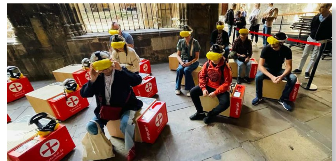
Visitantes disfrutando de la experiencia en el claustro de la Catedral de Barcelona